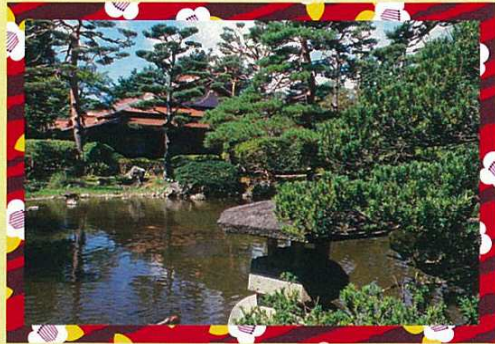
鳥潟会館 (秋田県指定文化財・名勝) Torigata Family Estate

Tangible cultural property and scenic beauty designated by Akita prefecture