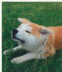
Photo ops with Akita dogs at the Taiko Bridge 在太鼓桥听秋田名犬故事