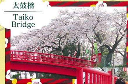
太鼓橋 Taiko Bridge

Photo ops with Akita dogs at the Taiko Bridge